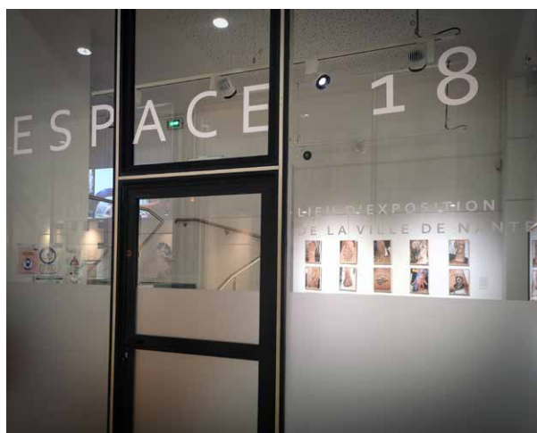
Espace 18, exposition Jean-Félix Fayolle, WAVE 2021